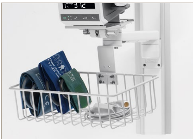
Wandhalterung mit Korb

Verschiedene Montageoptionen machen den SC300 noch flexibler: Ein mobiler Ständer mit integrierter Zubehörablage, eine Wandhalterung (ebenfalls mit Zubehörablage) oder die Befestigung an einem Infusionsständer (ideal bei beengten Platzverhältnissen) stehen dem Benutzer als Auswahl zur Verfügung.