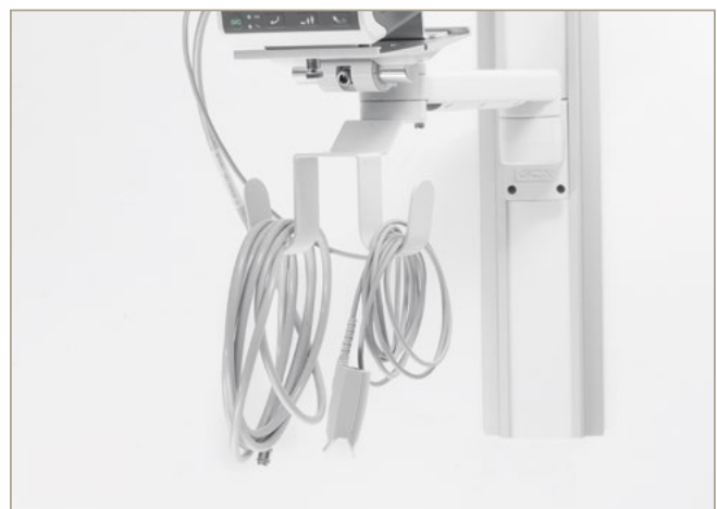
Wandhalterung mit Haken